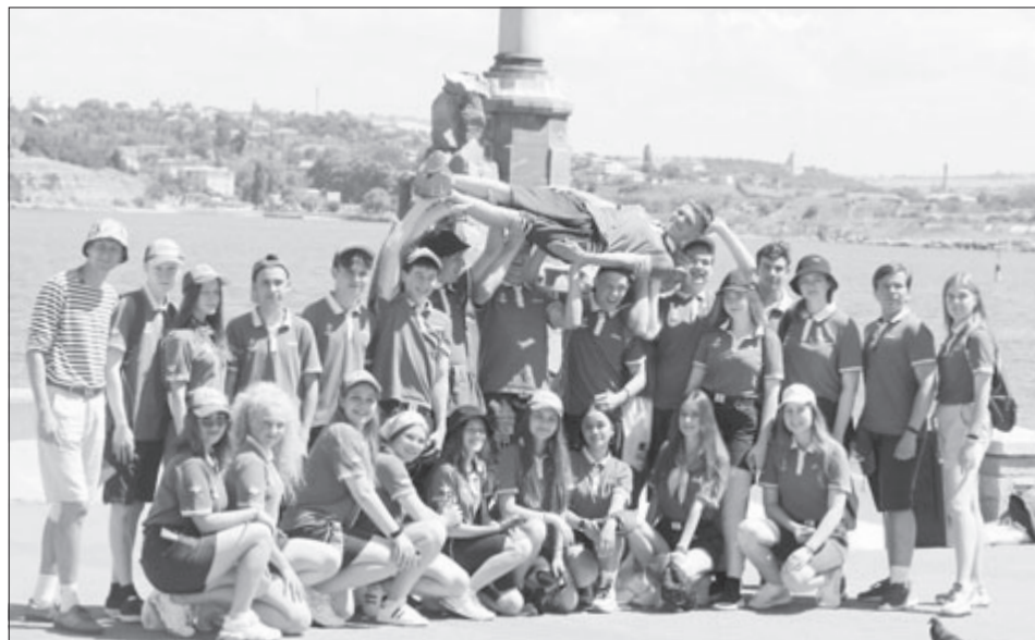
Отряд «Морской» у памятника затопленным кораблям в Севастополе.