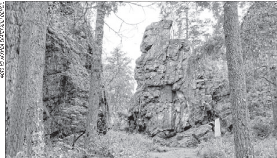
Скала, на которой изображена Девка-Азовка.

вторую гору – Думную. Хоть эта гора и ниже, но забираться на неё труднее. Раньше на эту гору приходили люди, чтобы принять решение, поэтому гору так и назвали. На горе плавил медь, археологи обнаружили остатки восьми медеплавильных печей. Ещё на этом месте можно найти маленькие кусочки малахита. Когда нам об этом сказали, все ринулись искать. Найти их было трудно, но большинство ребят нашли несколько штук. Надолго задержаться мы не могли, поэтому перед тем как вернуться в автобус, мы последний раз посмотрели вокруг. Вид потрясающий, словно весь город на ладони. Красота!