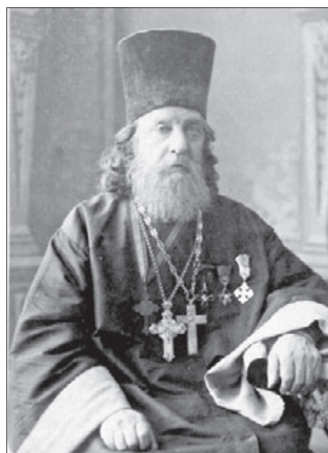
Настоятель Камышловского Покровского собора благочинный первого Камышловского округа протоиерей Николай Иоаннович Оранский скончался 13 января 1891 года, на 73-м году от рождения. По свидетельству очевидца, собор, в котором проходило отпевание, был переполнен людьми, пришедшими отдать дань уважения этому человеку.

которые выдержки из материала: «23 января 1839 года он произведён был во священника Шадринского уезда, к Знаменской церкви Замараевского села. В 1856-м переводится из Замараевского села в село Фоминское, Верхотурского уезда... В 1880 году по собственному прошению перемещён настоятелем к Камышловскому собору, где определяется директором Камышловского тюремного комитета и