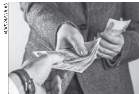
Получить имущественную выгоду там, где не положено, стало, к сожалению, привычным делом.

Коррупцию и взяточничество удастся победить и искоренить только тогда, когда общество осознает всю опасность данного явления, ведь даже на местном муниципальном уровне можно построить осознанное противодействие коррупции. Гражданам, столкнувшимся с коррупционными преступлениями, совершёнными на территории органов государственной власти, необходимо сообщать об этом в отделение экономической безопасности и противодействия коррупции МО МВД России «Камышловский» (Камышлов, ул. Свердлова, 61, кабинет 58) либо по телефонам: 8 (34375) 2-08-31, 2-08-30. Кроме того, инфор-