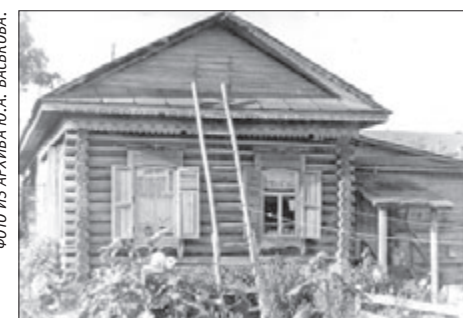
Дом по ул. Свердлова, 45, в котором в конце XIX века жил отец Оранский, вид со двора.

которые выдержки из материала: «23 января 1839 года он произведён был во священника Шадринского уезда, к Знаменской церкви Замараевского села. В 1856-м переводится из Замараевского села в село Фоминское, Верхотурского уезда... В 1880 году по собственному прошению перемещён настоятелем к Камышловскому собору, где определяется директором Камышловского тюремного комитета и