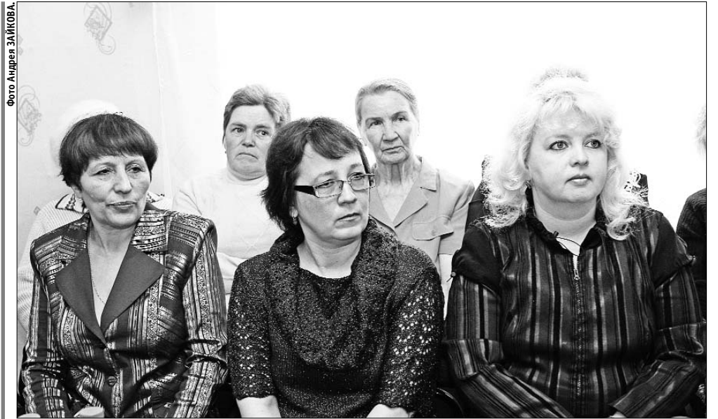
Участники первого заседания нового клуба.