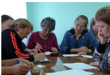
Кустовой семинар на базе УИК №829

Немаловажным конечно остается также метод