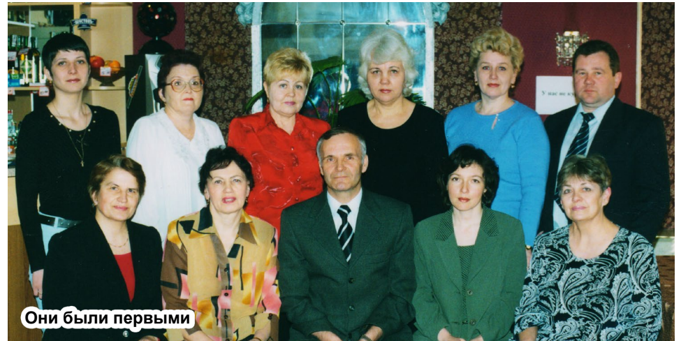
Они были первыми