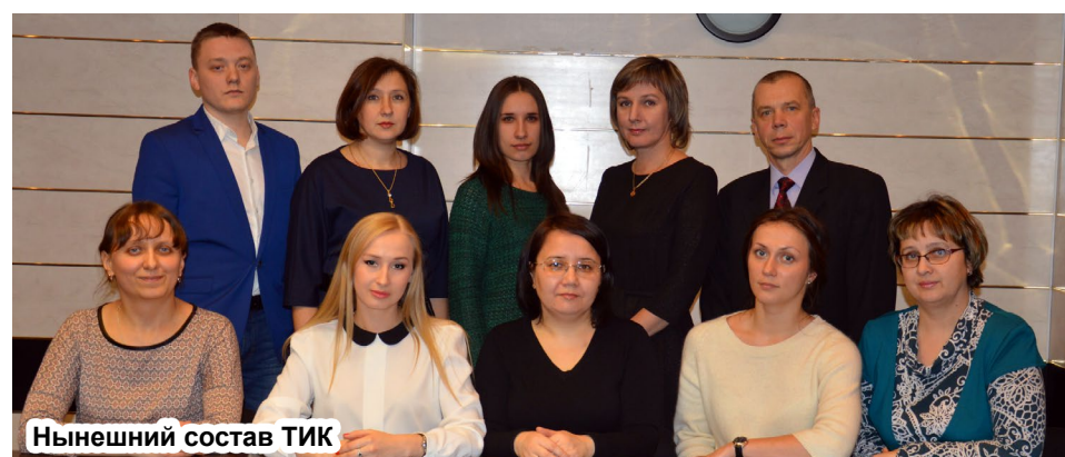
Нынешний состав ТИК

Анастасия ЧЕРНОВА